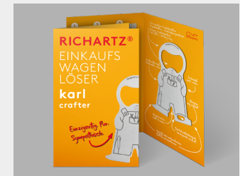
... mit Standardverpackung